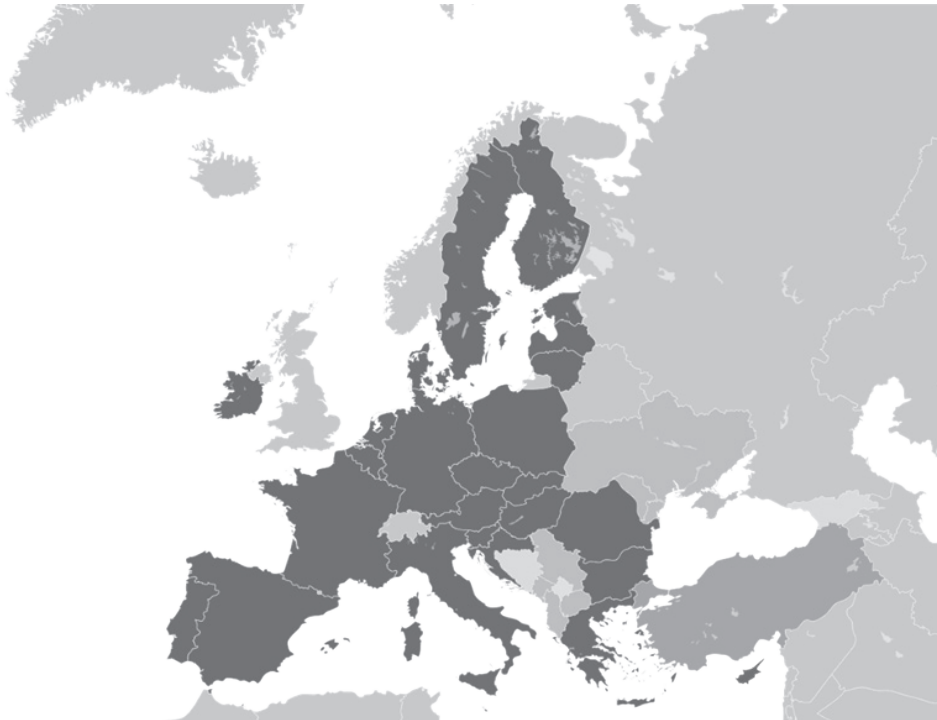
Mapa č. 2: Aktuálna agenda rozšírenia

ky znamenať pre EÚ vojnu s Ruskom, čo, samozrejme, nechcú. Európska únia je totiž od roku 2008 aj vojensko-obrannou alianciou a to na základe článku 42 ods. 7 ZEÚ. Na druhej strane samotná okupácia alebo nelegitímne odtrhnutie častí územia nemusí byť prekážkou členstva v EÚ. Dobrým príkladom sú Cyprus alebo Nemecko (Západné) v r. 1957 – 1973, ktoré považovalo vtedajšiu NDR len za územie okupované ZSSR.